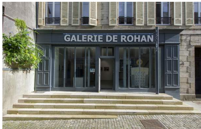
Galerie de Rohan

Créée à l'initiative de la Ville de Landerneau qui a souhaité placer ce mandat sous le signe de l'art contemporain, la Galerie de Rohan a pour ambition de faire découvrir des artistes connus ou en devenir et de faciliter la rencontre entre ces œuvres et le public.