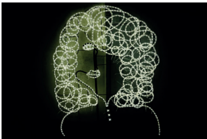
Ron Haselden, Sœur . Aubenas, 2015

S'il se considère comme un sculpteur, Ron Haselden use de toutes sortes de techniques et de matériaux pour développer un travail qui prend la forme aussi bien d'images photographiques ou de vidéos que de sculptures ou de dessins dans l'espace. Il aime à travailler avec un contexte particulier, qu'il soit proche ou lointain, découvert au gré des invitations ou arpenté quotidiennement en proximité de son village. À petite ou grande échelle, dedans ou dehors, il s'emploie à tisser des liens entre les gens et dans le paysage, comme tout récemment en Bretagne ( Papillon de la nuit , vaste installation réalisée en 2013-2014 pour la 2 e édition de l'Art au fil de la Rance, et Sealife , sculpture éphémère de 2016 pour le Festival de l'Estran sur la côte de Granit Rose).