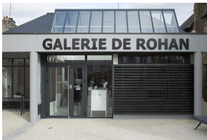
Galerie de Rohan. Entrée principale, place Saint-Thomas