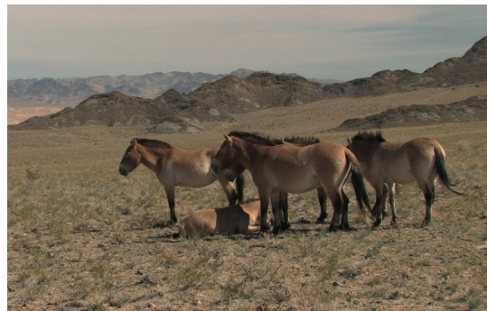
La ligne du dessus