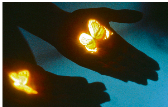
Les papillons 1998