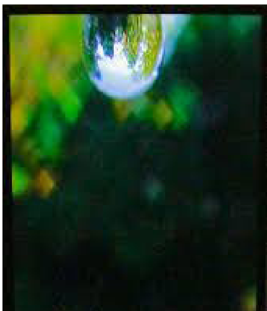
La Goutte d'eau