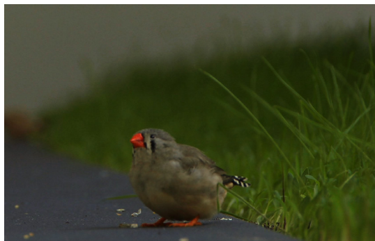
Un oiseau de Céleste