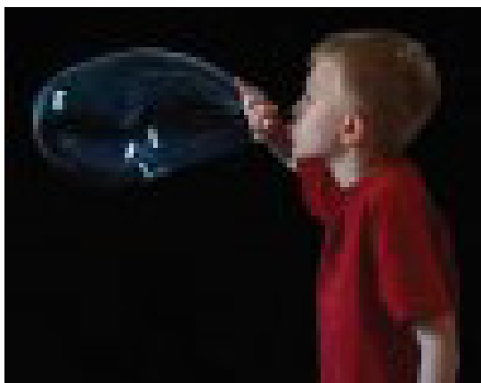
Le souffleur de bulle 2003

En cela, il joue sur le pouvoir des images, sémantique, symbolique et subjectif. Il veut ses images épurées. L'imaginaire du regardeur la complète et sa réaction crée la fiction narrative : le passant qui réagit face à une image surprise est comme figurant à l'intérieur d'un film.