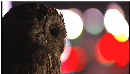
Les yeux ronds

Pour la Galerie de Rohan elle propose un voyage rétrospectif dans le bestiaire vidéo qu'elle a élaboré au cours de ses tournages dans des pays parfois lointains. Cherchant des «décors» souvent nus ou «premiers», elle s'est postée auprès des mondes non-humains pour nous offrir des expériences nouvelles du monde. Toujours mue par une volonté sourde de rejouer nos mythes d'origine, elle nous propose ici un voyage dans ses récits minimaux comme dans une seule grande histoire.