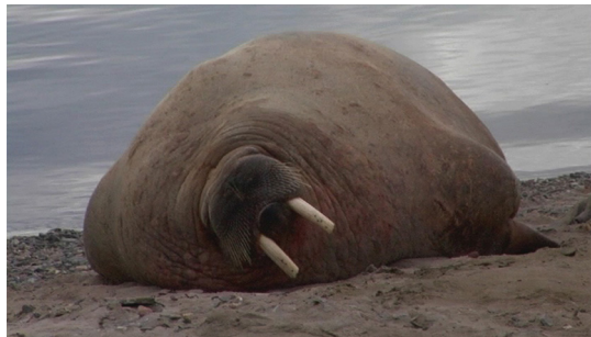
Sur la terre