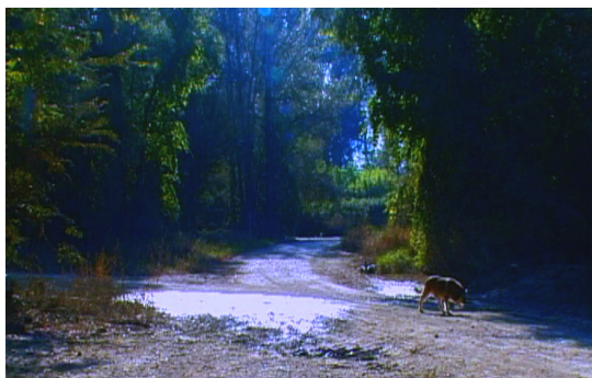
Après les pluies